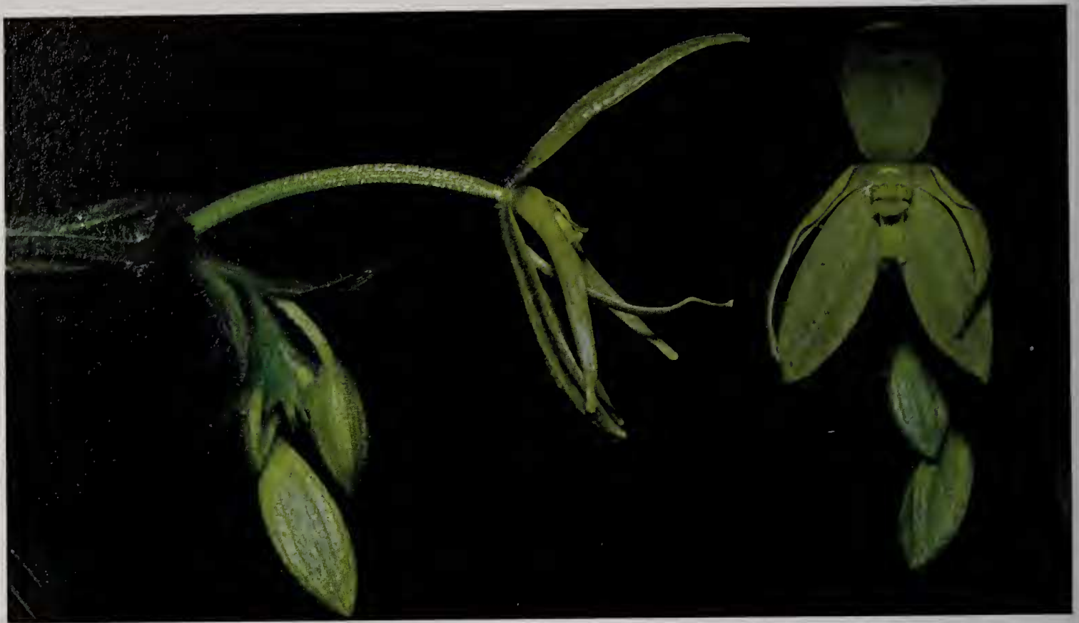
Fig. 3 : Selenipedium chironianum